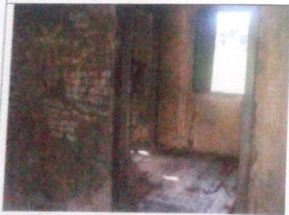
Vista do interior da sede, rachaduras, vandalismo e piso deteriorado.