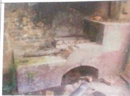
Fogão à lenha no interior da cozinha da edificação.