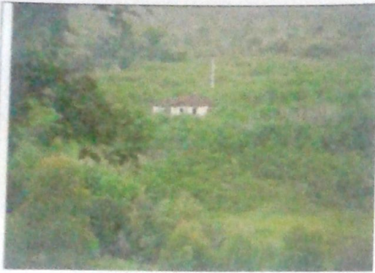
Vista da sede pelo acesso á cachoeira São Thomé.