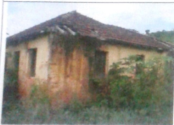
Vista lateral da sede.