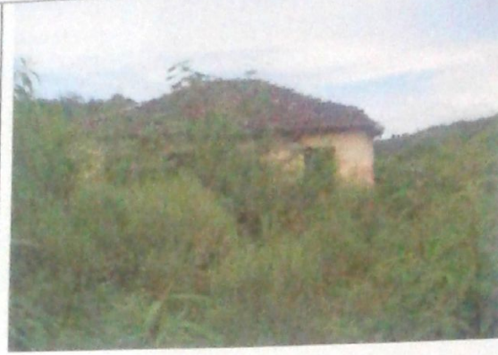
Via de acesso frontal à sede da Faz. Rio do Peixe.