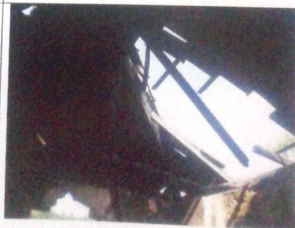
Telhado da cozinha que cedeu.