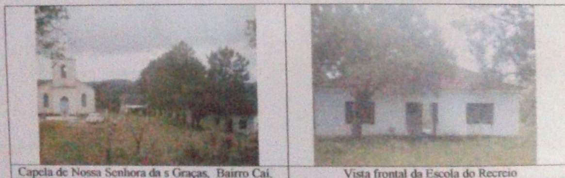
Capela de Nossa Senhora da s Graças, Bairro Cai.

09. Documentação fotográfica: Luan Ariel Sigaud Vasconcellos dos Santos, Câmera Lenox Digital 3.1 Mega pixel,08/01/2010