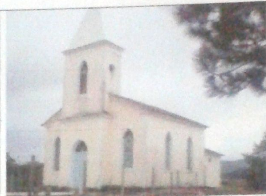
Vista lateral da Capela Nossa Senhora das Graças