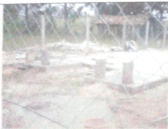
Construção da pracinha frontal