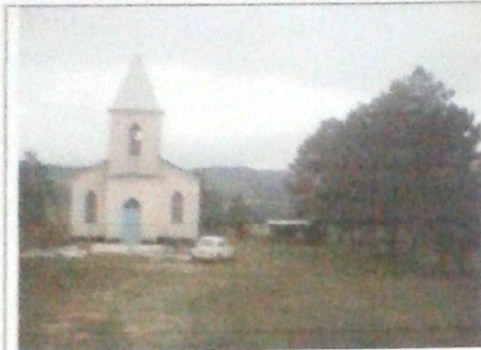
Vista da entrada no terreno

09. Documentação fotográfica: Luan Ariel Sigaud Vasconcellos dos Santos, Câmera Lenox Digital 3.1 Mega pixel, 07/01/2010.