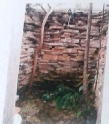
Foto 03- Detalhe interno do banheiro Município de São Thomé das Letras - MG Adane Soares Marques | março - 2009