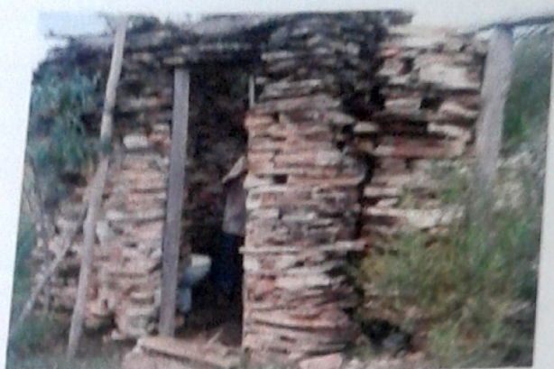
Foto 01- Banheiro externo Município de São Thomé das Letras - MG Adane Soares Marques | março - 2009