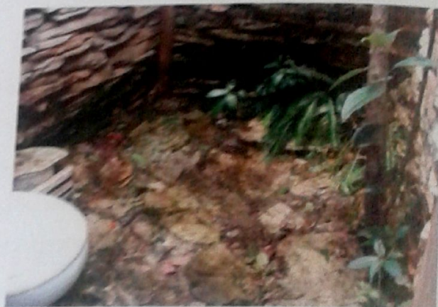
Foto 04- Detalhe do piso de pedra Município de São Thomé das Letras - MG Adane Soares Marques | março - 2009